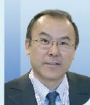
李建兴 教授 清华大学附属北京清华长庚医院