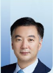
邢念增 教授 中国医师协会泌尿外科医师分会会长