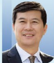
董家鸿 院士 中国工程院