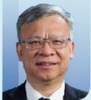
黄健 主任委员 中华医学会泌尿外科学分会