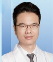
林天歆 教授 中山大学孙逸仙纪念医院