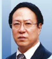
吴以岭 院士 中国工程院