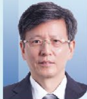
施剑林 院士 中国科学院