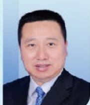
秦卫军 教授 空军军医大学西京医院