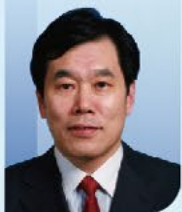
赫捷 院士 中国科学院