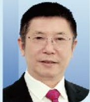
张旭 院士 中国科学院