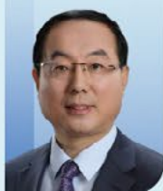
纪志刚 教授 中国医学科学院北京协和医院