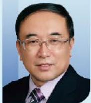
于金明 院士 中国工程院