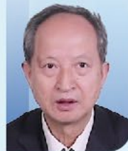
杨民 副会长 中国医师协会