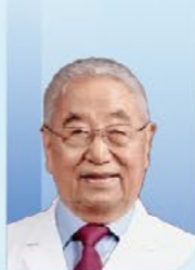
郭应禄 院士 中国工程院