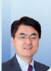
周利群 教授 北京大学第一医院