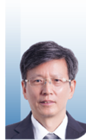
施剑林 院士 中国科学院