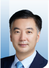
邢念增 教授 中国医师协会泌尿外科医师分会会长