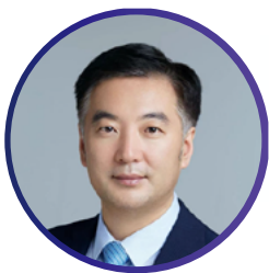
中国医师协会泌尿外科医师分会 会长