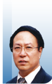
吴以岭 院士 中国工程院