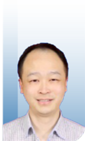
Fam Xeng Inn (马来西亚)