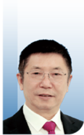
张旭 院士 中国科学院