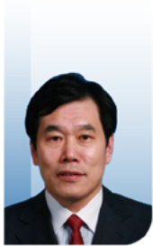
赫捷 院士 中国科学院