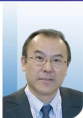
李建兴 教授 清华大学附属 北京清华长庚医院