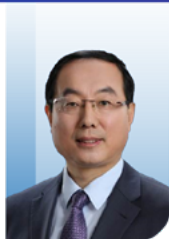
纪志刚 教授 中国医学科学院 北京协和医院