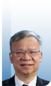
黄健 主任委员 中华医学会泌尿外科学分会