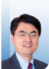
周利群 教授 北京大学第一医院