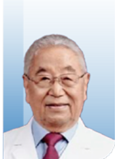
郭应禄 院士 中国工程院