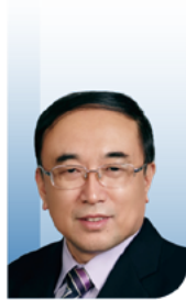
于金明 院士 中国工程院